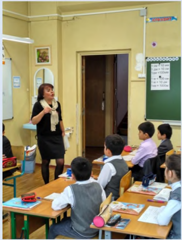
Урок во 2г классе